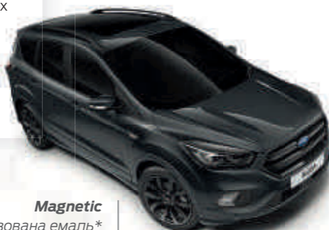
Magnetic Колір кузова, металізована емаль*