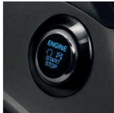
● Запуск без ключа