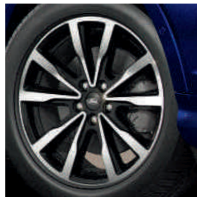
● 18-дюймові легкосплавні колісні диски