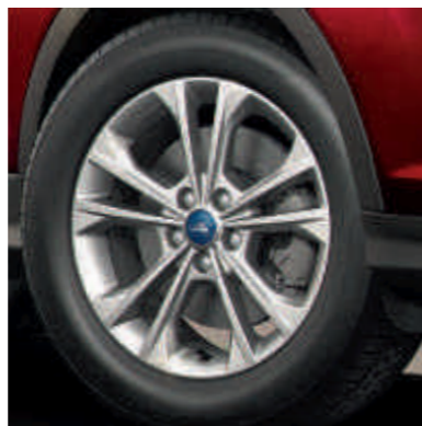
● 17-дюймові легкосплавні колісні диски