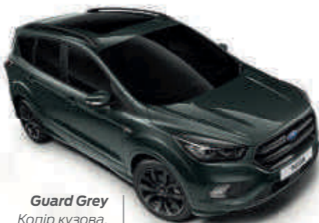
Guard Grey Колір кузова, металізована емаль*