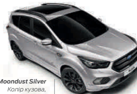
Moondust Silver Колір кузова, металізована емаль*