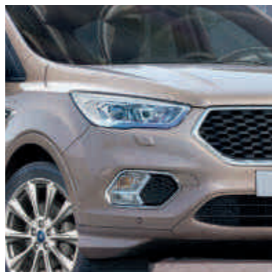
● Ексклюзивний зовнішній дизайн Ford Vignale