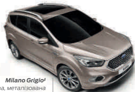
Milano Grigio † Колір кузова, металізована емаль*

Trend Td Td Business B B Titanium T T Vignale V V ST-Line SL SL Стандарт Опція