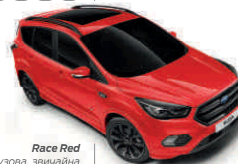
Race Red Колір кузова, звичайна емаль