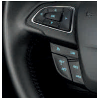
● Круїз-контроль, що включає регульований обмежувач швидкості