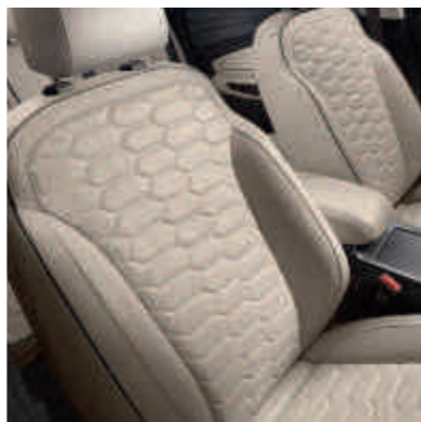
● Ексклюзивна оббивка сидінь шкірою преміум Vignale