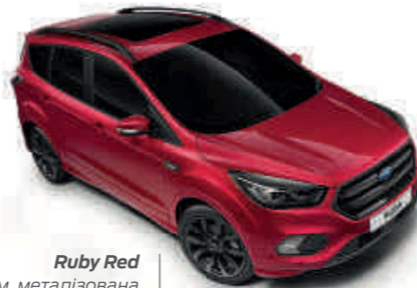
Ruby Red Колір кузова преміум, металізована емаль*