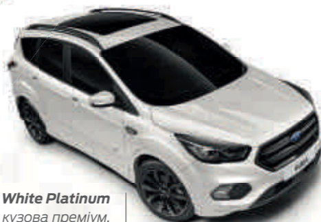
White Platinum Колір кузова преміум, металізована емаль*