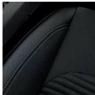
● Часткова шкіряна оббивка сидінь