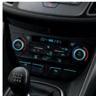
● Двобонне електронне автоматичне регулювання температури повітря (DEATC)