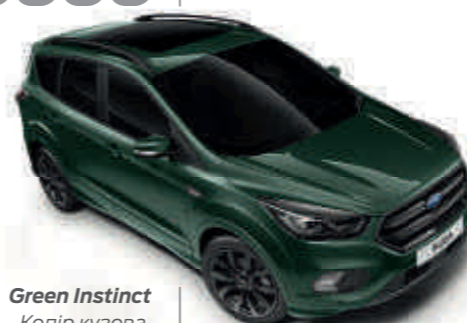
Green Instinct Колір кузова, металізована емаль*