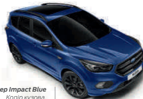
Deep Impact Blue Колір кузова, металізована емаль*