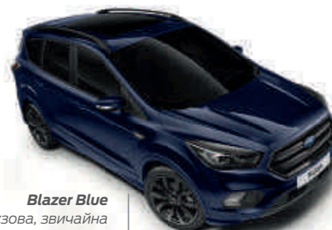
Blazer Blue Колір кузова, звичайна емаль*