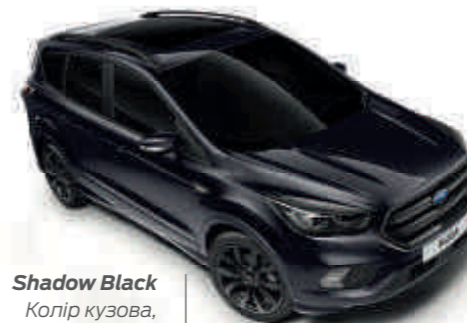
Shadow Black Колір кузова, металізована емаль*