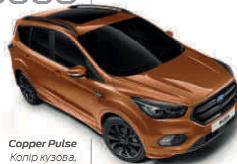
Copper Pulse Колір кузова, металізована емаль*