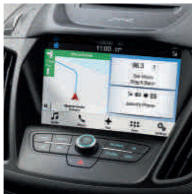
● Ford SYNC 3 із голосовим керуванням і 8-дюймовим сенсорним екраном