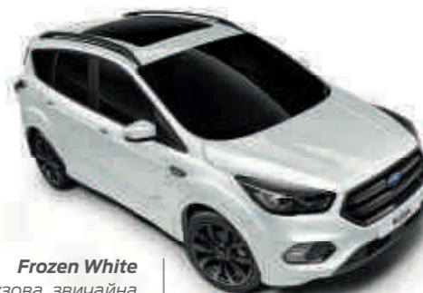
Frozen White Колір кузова, звичайна емаль