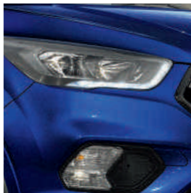
● Чорні оправы фар